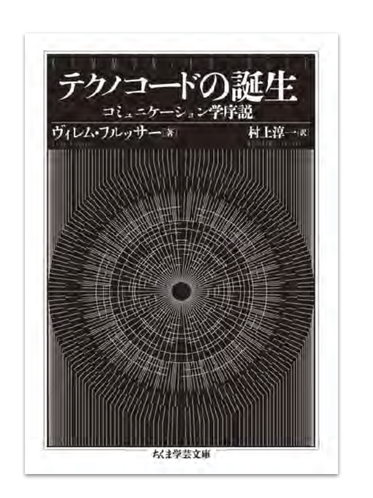
ちくま学芸文庫 - 2023/9/11

ヴィレム フルッサー (著) 村上 淳一 (翻訳) 東京大学出版会 (1997/3/1)